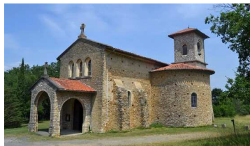
Notre-Dame de Saint-Bernard

9h00 Eglise de Saint-Plancard 10h30 Collégiale de Saint-Gaudens 10h30 Eglise d'Aspet 10h30 Eglise de Montréjeau 10h30 Eglise de Salies du Salat 11h00 Cathédrale de Saint-Bertrand de Cges