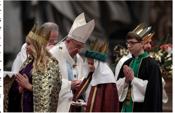
Le pape François avec les enfants déguisés en rois mages lors de la messe du 1er janvier en la basilique Saint-Pierre de Rome

François a en effet écrit aux évêques du monde pour leur demander de défendre les enfants « des Hérode de notre époque ». Reparlant de la joie de Noël, le pape commence par rappeler que « nous avons été appelés pour aider à faire grandir cette joie au milieu de notre peuple ». « Je souhaite renouveler avec toi l'invitation à ne pas nous laisser voler cette joie », écrit-il en tutoyant chaque évêque, et en soulignant aussi combien Noël « est accompagnée de pleurs », les « gémissements de Rachel » dont l'évangéliste Matthieu se fait l'écho après le massacre des Saints Innocents.